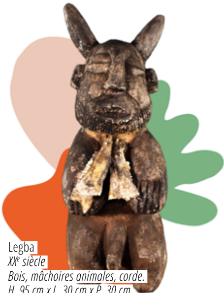
Legba XX e siècle Bois, mâchoires animales, corde. H. 95 cm x L. 30 cm x P. 30 cm N o d'inventaire : 1422

Désigné comme le vodou des unions, il permettrait de les sceller, de les faire perdurer ou d'obtenir le retour de l'être aimé. Gambada est sollicité quotidiennement pour résoudre de nombreux problèmes et notamment faire gagner les matchs de sport. Pour l'utiliser, l'intéressé fait fabriquer une flûte ou un sifflet magique par un prêtre bokono. Seules les personnes généreuses et honnêtes peuvent bénéficier de ses services.