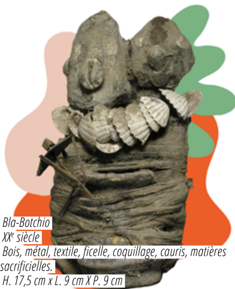
Bla-Botchio XX e siècle Bois, métal, textile, ficelle, coquillage, cauris, matières sacrificielles. H. 17,5 cm x L. 9 cm X P. 9 cm N° d'inventaire : 0310C