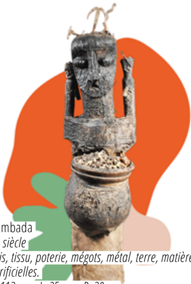
Gambada XX e siècle Bois, tissu, poterie, mégots, métal, terre, matières sacrificielles. H. 113 cm x L. 25 cm x P. 30 cm N o d'inventaire : 1292