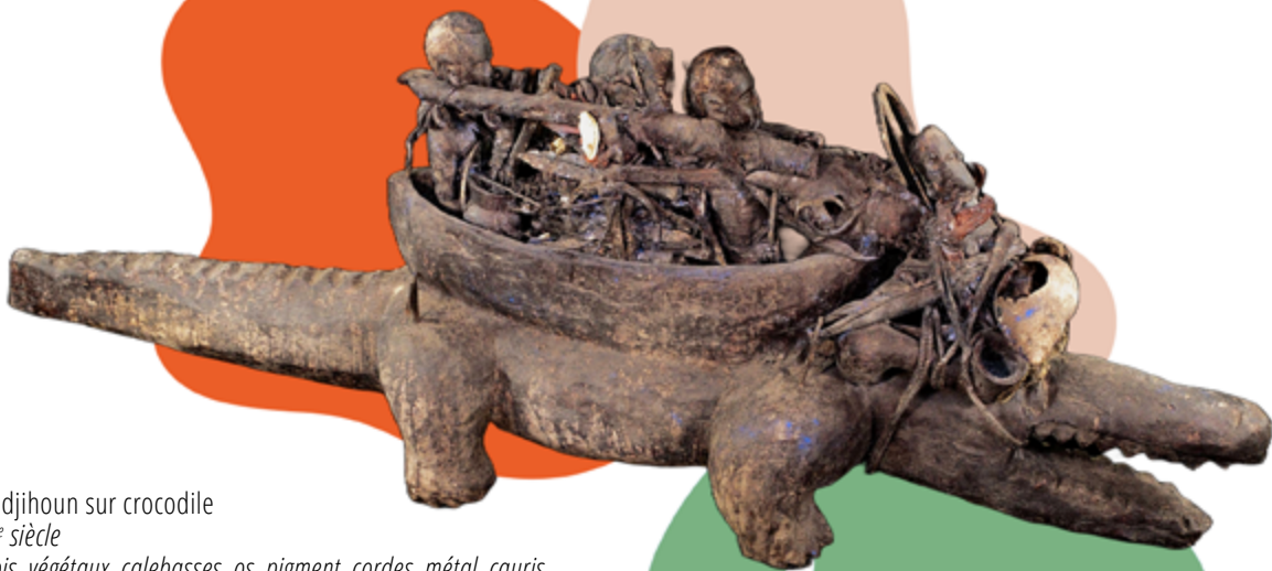
Todjihoun sur crocodile

Ces pirogues (todjihoun en langue fon) sont des offrandes et commémorent la mémoire des esclaves offerts aux divinités. Elles expriment le désir des humains de régler les difficultés propres à leur vie sur terre, en invoquant les puissances de la nature et la force de leurs ancêtres. Elles sont l'expression matérialisée des prières pour favoriser la santé, l'amour, la prospérité. Là où elles sont installées, elles augmentent le potentiel magique du lieu.