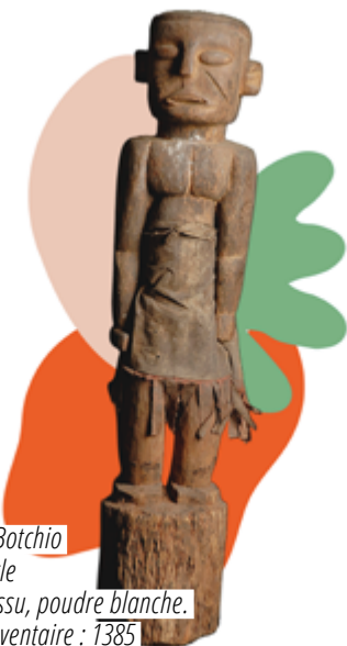
Kudio-Botchio XX e siècle Bois, tissu, poudre blanche. N° d'inventaire : 1385

Autel utilisé par un hounon lors de rituels d'attachement, en lien avec Gou. Divinité du fer, des carrefours et de la technologie, Gou a deux fonctions principales ambivalentes : il permet de voyager ou créer des accidents. Tout dépend de l'intention.