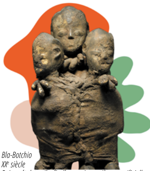
Bla-Botchio XX e siècle Bois, métal, textile, ficelle, cauris, matières sacrificielles. H. 21 cm x L. 11,5 cm X P. 13 cm N° d'inventaire : 0340C