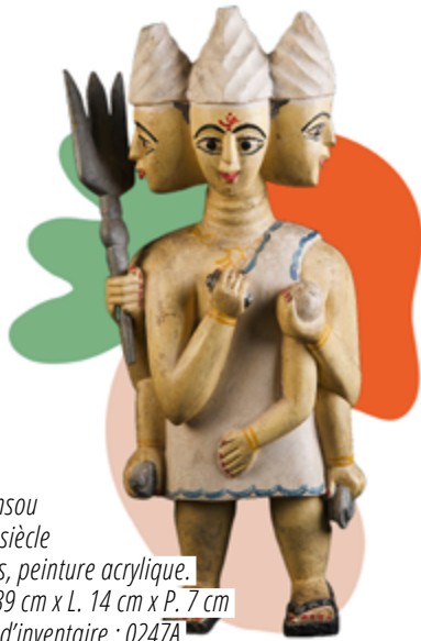
Dansou XX e siècle Bois, peinture acrylique. H. 39 cm x L. 14 cm x P. 7 cm N° d'inventaire : 0247A