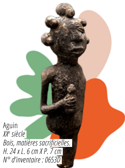
Aguin XX e siècle Bois, matières sacrificielles. H. 24 x L. 6 cm X P. 7 cm N° d'inventaire : 0653D