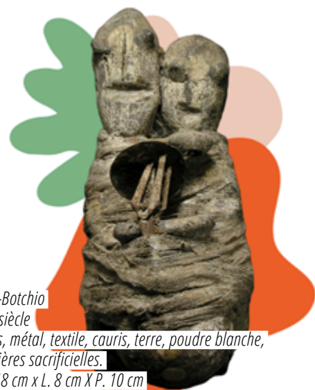
Bla-Botchio XX e siècle Bois, métal, textile, cauris, terre, poudre blanche, matières sacrificielles. H. 18 cm x L. 8 cm X P. 10 cm N° d'inventaire : 0348C