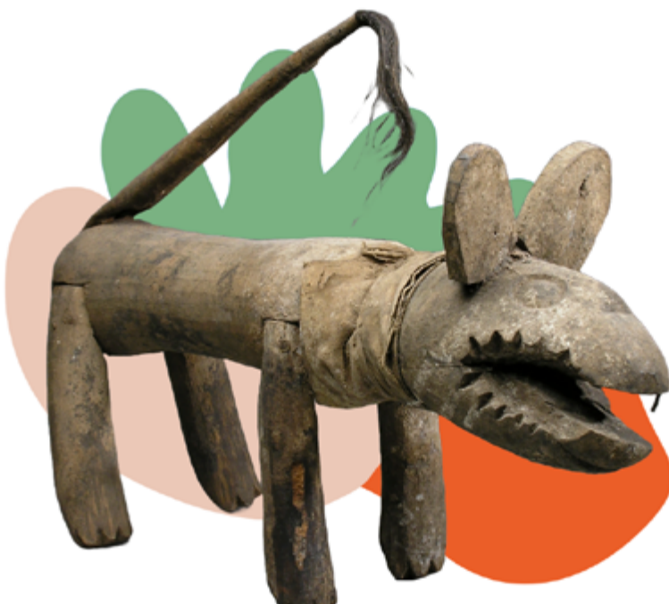
Legba XX e siècle Bois, terre, coton, crin, cuivre. H. 33 cm x L. 51 cm x P. 14 cm N o d'inventaire : 0509C

Il est le vodou messager entre les êtres humains et les divinités, tel Hermès. Figure rusée et imprévisible, il peut n'en faire qu'à sa tête jusqu'à modifier le message à transmettre. Ainsi, il mettrait à l'épreuve la sincérité des personnes qui le sollicitent. Il est parfois représenté avec une tête de chien, parfois avec des cornes.