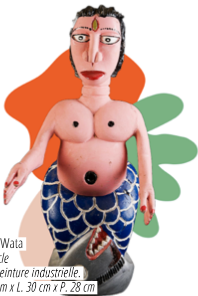
Mami Wata XX e siècle Bois, peinture industrielle. H. 63 cm x L. 30 cm x P. 28 cm N° d'inventaire : 0833

Ce vodou est le vodou des chasseurs et de la forêt. Il connaît tous les mystères des plantes et de la médecine traditionnelle. Représenté doté d'un seul pied, d'un bras et d'un seul œil, on le pare d'une chevelure abondante ou d'un seul long cheveu qui s'enroule autour de son corps à la manière d'une liane. Aguin demeure dans les termitières et sort à la tombée de la nuit en sifflant. Il soigne par les plantes et protège les forêts.