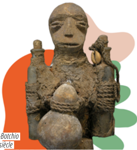
Bla-Botchio XX e siècle Bois, cordelette, coton, fil,alebasse, bouteille en verre, cauris, matières sacrificielles. H. 22 cm x L. 13 cm X P. 12 cm N° d'inventaire : 0381C