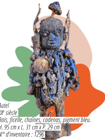
Autel XX e siècle Bois, ficelle, chaînes, cadenas, pigment bleu. H. 95 cm x L. 31 cm x P. 29 cm N° d'inventaire : 1296

Dansou ou Papa Dansou est un vodou masculin, aux attributions proches de celles de Mami Wata, il possède trois têtes comme la Trimurti qui symbolise la Grande trinité hindoue. L'un de ses visages est tourné vers le passé, l'autre vers le présent et le dernier vers l'avenir.