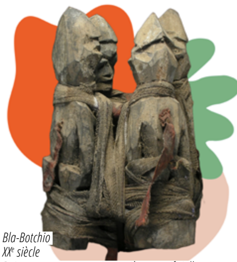
Bla-Botchio XX e siècle Bois, coton, terre, poterie, matières sacrificielles. H. 18 cm x L. 13 cm X P. 11 cm N° d'inventaire : 0394C

Le botchio est la représentation physique du bo qui signifie « charme » en fon. Les Bla-Botchio sont créés pour attacher ou séparer (bla signifie attacher). Lorsque l'attachement est fait avec des fioles ou des bouteilles, il s'agit d'un objet protecteur. Ces objets peuvent être personnels ou collectifs.